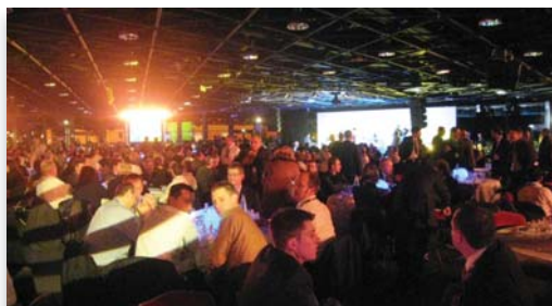
Delegații la conferința CNH din Cannes (Franța)

În februarie, la Cannes (Franța), peste 1000 de dealeri Case - New Holland din toată Europa, precum și conducerea CNH și directorii Grupului Fiat au participat la Conferința distribuitorilor. La conferința de 2 zile au fost prezenți și furnizorii preferați ai CNH care și-au prezentat produsele și serviciile la Târgul organizat în incinta unde